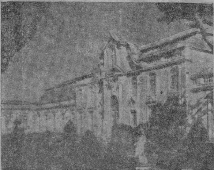
Una visita del Palacio de Queluz, residencia del Caudillo durante su estancia en Portugal

En la eventualidad de que esto suceda, la escuadra española permanecerá en el Tajo hasta el próximo jueves.