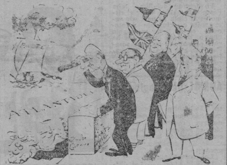
¿PACTO DEL ATLANTICO O PACTO DE LOS SUSPIROS? (De "L'Aurore-Paris")

Esta noche circulaban en Praga numerosos rumores acerca de detenciones sensacionales, desapariciones misteriosas y tiroteos.