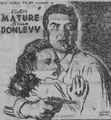
El BESO de la MUERTE DIRECTOR HENRY HATHAWAY

Una película basada en una novela que fué escrita con una ametralladora!