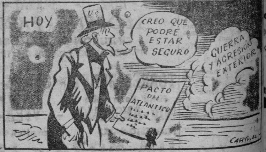
(De "The Chattanooga Times")