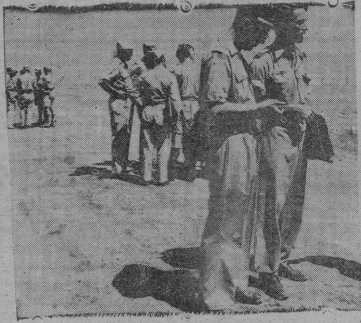
También se preguntan estos soldados franceses: por qué se hizo la guerra.

—Pero no se acuerda usted que los primeros bombardeos de los suburbios de Varsovia, ni de cómo la caballería polaca fué a la muerte en la región de Czesochv al tratar de detener el avance de las "Panzerdivisionen"?