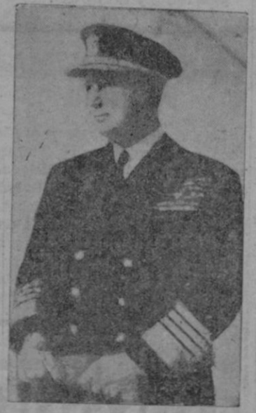
El Almirante Connolly en su momento de salida de la escuadra norteamericana.

El primer buque en iniciar las labores de desamarré fue el destructor "Bordelon".