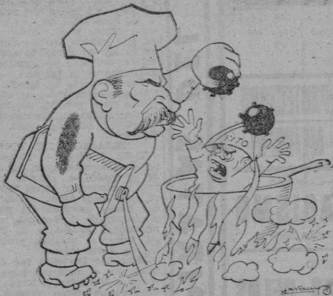
Cocido en su propia salsa.