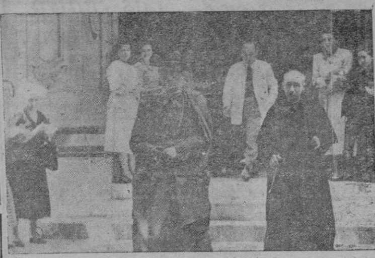
El Excmo. y Rdmo. Sr. Obispo al salir de la Sala Born, después del importante acto celebrado por las Mujeres de Acción Católica

El capital de la nueva sociedad asciende a 325 millones de pesetas. Las negociaciones que han conducido a la constitución de la nueva sociedad se han desarrollado en un ambiente de gran cordialidad y se estima que aquella reportará grandes beneficios a la economía española, tanto en el aspecto meramente industrial como en el de nivelación de nuestra balanza de pagos.