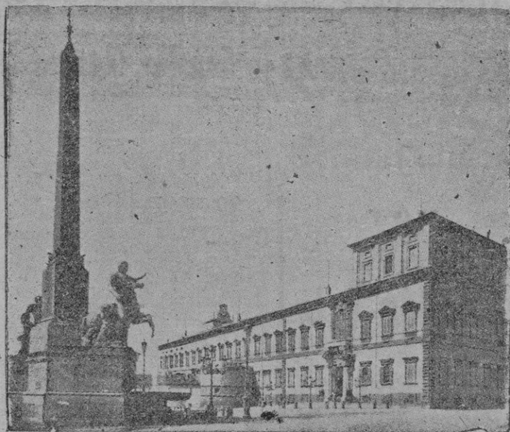
ROMA. — Palacio del Quirinal

la emigración, impedir los despidos en las fábricas y empresas y hacer la reforma agraria. Cuaquiera de esos proyectos es de ejecución muy difícil, máxime si se cuenta con la presencia del numeroso partido comunista de Italia. O sea, con las huelgas, los sabotajes y la inseguridad. Italia tiene el paro obrero y el partido comunista más numeroso de Europa, esto es tanto más lamentable cuanto ambos se influyen y estimulan su mutuo crecimiento.