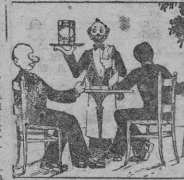
Los Barquillos Galindo son el complemento de un buen helado, se fabrican en todos los gustos. Calidades inmejorables. Calle Cordelería núm. 14.

Igualmente por este Ministerio se fijarán las superficies mínimas que en cada provincia deben sembrarse de garbanzos, lentejas, habas, maíz y centeno.