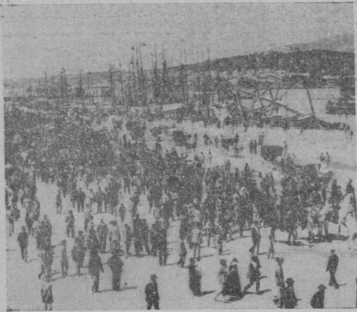
Palma, 1899. — Llegada del "Orfeo Catalá" al puerto de Palma; el pueblo mallorqués acude a recibirle y entra en la ciudad precedido de la guardia municipal montada.

Su vida está ligada íntimamente hasta 1941 con la de su primer director el maestro Luís Millet