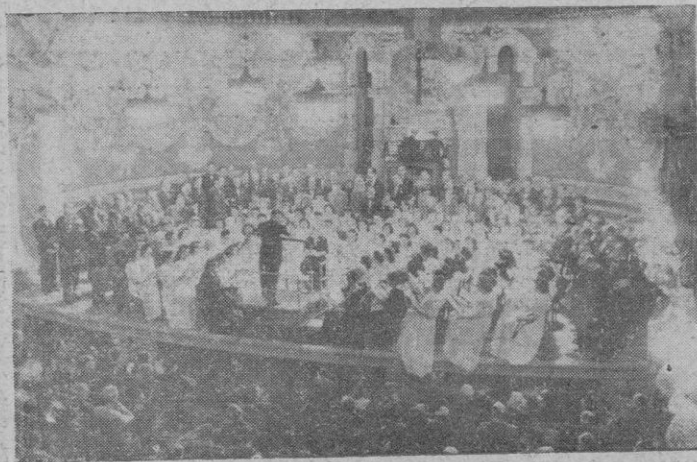
El "Orfeo Catalá" en una de sus actuaciones en la Palacio de la Música

Desde entonces los triunfos alcanzados en cuantas actuaciones ha desarrollado tanto en