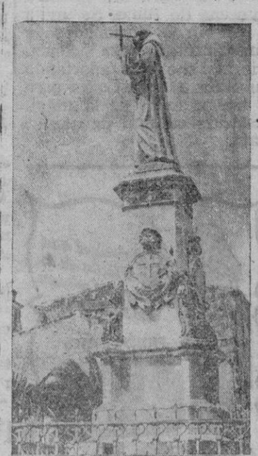
Monumento a Fr. Juniperó Serra existente en Petra

A las tres llegó al santua... rio la banda de música "San... ta Cecilia", de Porreras, que