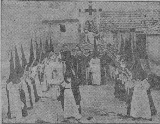
El nuevo paso de la Piedad con la cofradía de Santo Tomás de Aquino