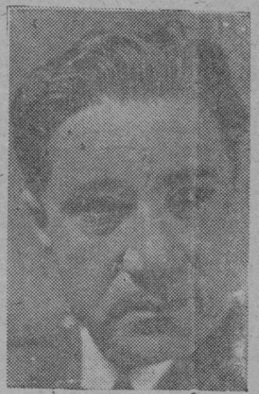
El general González Gallarza