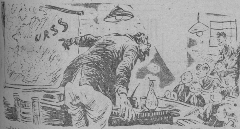
— Debéis amar mucho a Rusia, pequeños, porque tiende a simplificar cada día más el estudio de la Geografía. (De "Mare Aurelio" — Roma)