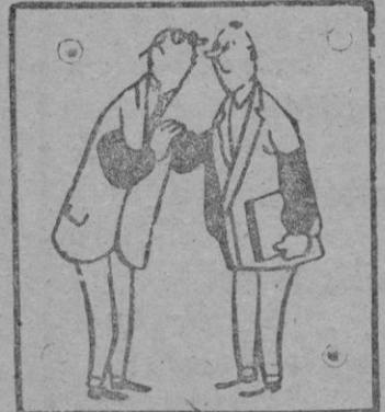
—Si, al parecer, a causa del informe que ha recibido de la Comisión de Bienes mal Administrados.