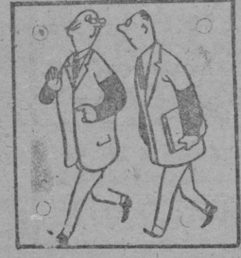
—Tengo la impresión de que el malhumor del ministro va a estallar de un momento a otro