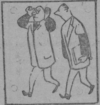
—¿Qué horrible humor tiene el ministro esta mañana!