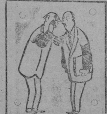
—Me temo que el ordenanza las va a pagar toda su jornada (De “La Rataille”, París)

de la Comisión de Estado de Planificación, el Mariscal Veshinine, Ministro adjunto de las Fuerzas Armadas de la Unión Soviética; Comandante Jefe del Ejército del Aire soviético, y Khunnechev, ministro de Industrias Aéreas de la URSS.