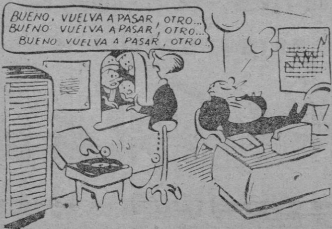
OFICINA PUBLICA (De "Marc'Aurelio" Roma)