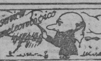
(Facilitado por el Servicio Meteorológico de Aviación)