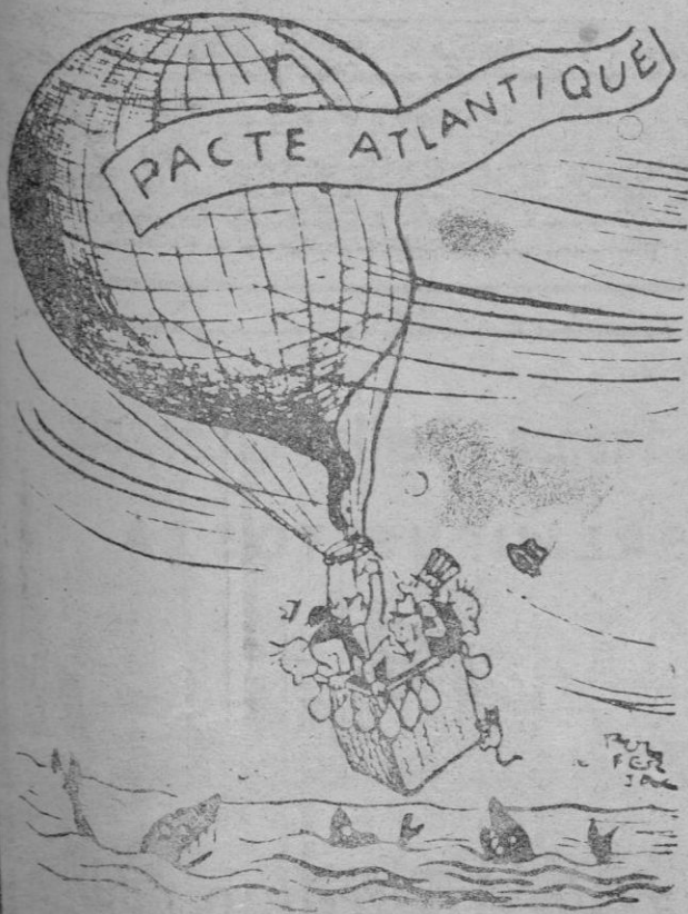
EL PACTO DEL ATLANTICO

Comunistas, 17 escaños; votos 1.689.764; 23'54 por ciento. Gaullistas y asociados, 170 escaños; 1.821.021 votos; 25'34 por ciento.