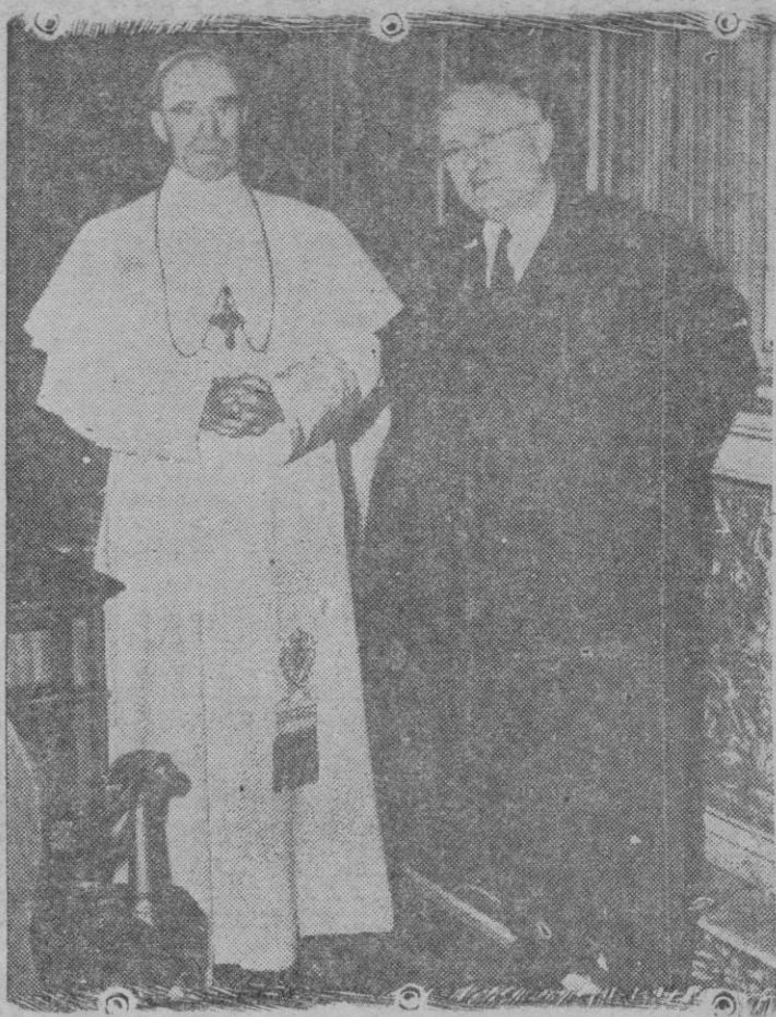
Camino de Londres, apretando su paso por la Ciudad Eterna, el ministro australiano de Asuntos Exteriores, Mr. Herbert Evatt, fué recibido en audiencia privada por S. S. Pío XII.