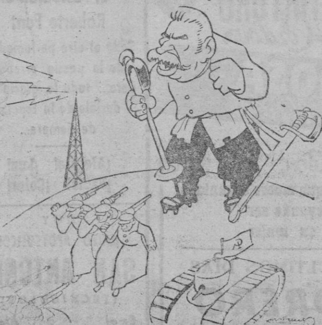
—Capturadas de todas las naciones del mundo; abrid las puertas al Ejército soviético que viene a liberaros.