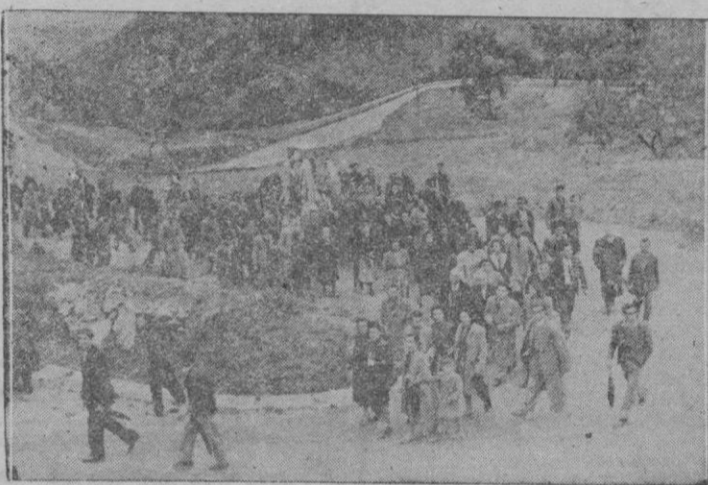
La Virgen de Lluch Peregrina y Pregonera del Año Mariano, llevada en hombros de fervorosos buñolífes, sube por la carretera de Sóller camino del Valle de los narancos