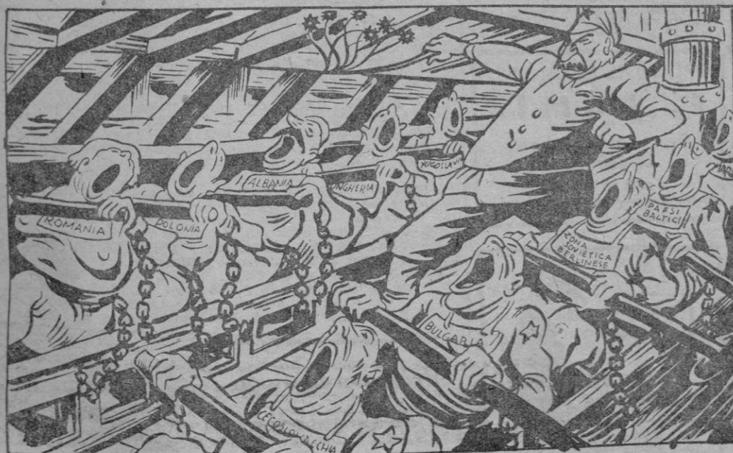
—Hijos míos! Antes de "liberar" a los pueblos de Occidente, os permito que gritéis: "Viva la libertad!"