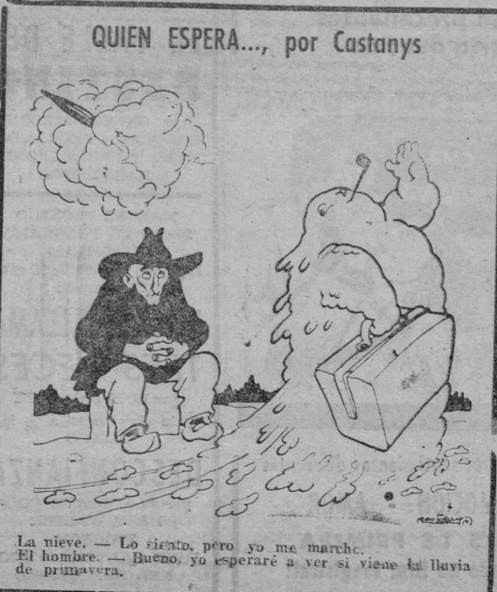
La nieve. — Lo siento, pero yo me marché. El hombre. — Bueno, yo esperaré a ver si viene la lluvia de primavera.

Ha hecho unas declaraciones en las que ha dicho que los pactos de que hoy se habla, el pacto del Atlántico y el pacto del Mediterráneo, estarían incompletos sin la inclusión de España. Ha hecho también consideraciones acerca de la situación y estrategia de nuestro país y de cómo se ha distinguido siempre Inglaterra por su democracia y tolerancia, y el inglés de hoy piensa que otros países tienen derecho a decidir sobre sus propios asuntos. Este es, al menos, el punto de vista conservador. El Foreign Office ya es otra cosa.