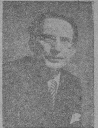
ALCIDES DE GASPERI

desarrolla su política. Porque quién iba a creer, al caer Mussolini, que Italia tenía preparados los hombres, los cuadros y los tópicos de los partidos? ¿Quién iba a decir, al surgir y multiplicarse los partidos, que éstos podrían enfrentarse con la realidad política interior y exterior, y que, al cabo de unos años, lejos de haberse diluido, sedimentarían, desde el poder o la oposición, a consolidarse, a definirse, a identificarse?