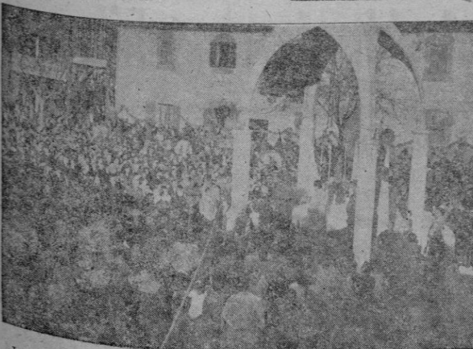
La primera foto recoge el acto mariano celebrado el domingo en la plaza de Villafranca de Borany del cual va amplia información en la tercera página. — La segunda foto capta el momento en que el Prelado dirige la palabra a la multitud congregada sobre Borany con ocasión del Congreso comarcal mariano.