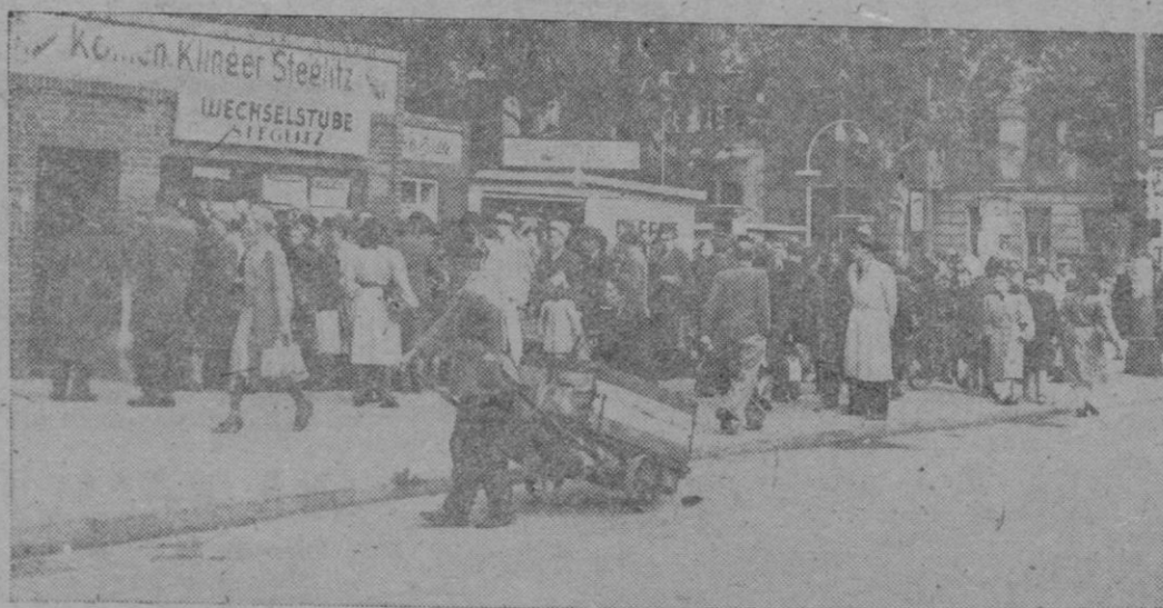
Ante la persistencia del bloqueo soviético de la capital alemana, se agudiza el problema alimenticio en ella y más todavía en estos días invernales en que se intensifican las necesidades.