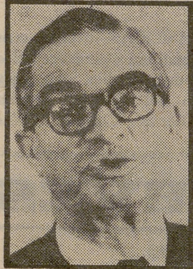
REY CONDECORADO. - El rey Balduino de Bélgica condecoró a los catorce miembros de la actual Comisión Europea, la ejecutiva del Mercado Común. El soberano belga impuso al presidente Jean Rey la gran cruz de la Orden de la Corona.

más que una planta, ha sido providencial para estas pobres gentes, que pudieron ponerse rápidamente a salvo. Pero las pérdidas que el incendio ha ocasionado, si bien no pueden ser de importancia, suponen todas las riquezas de los damnificados.