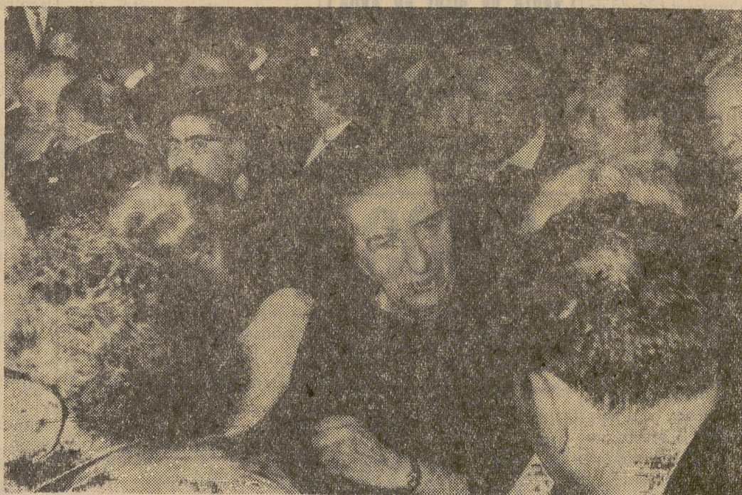
La primer ministro israelí, Golda Meir, rodeada de los miembros de su partido.

Porque ella sabe que nadie la dejará. Nadie puede vivir sin la abuelita. Para ella, Golda Shelanu —nuestra Golda— sigue siendo la mejor.