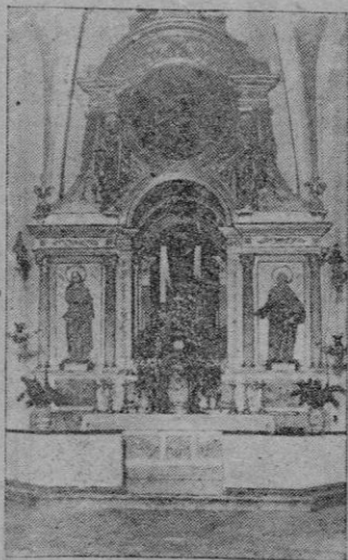
Retablo de la Capilla de Ntra. Sra. de los Dolores

Las primeras noticias que tenemos de la capilla —de forma octogonal gótica y de 244 metros cuadrados de extensión— se remontan al final del siglo XV.