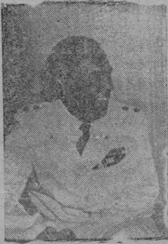
El Conde Folke Bernadotte

El reprobable crimen fué realizado en la aldea de Katamon.-- Hace días la organización judía "Stern" ya intentó asesinar al mediador de la O. N. U. en Palestina