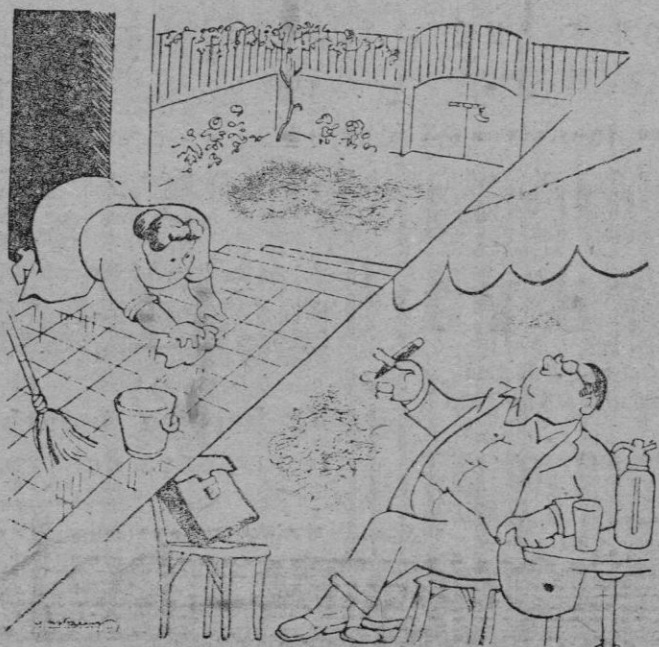
Mientras la esposa veranea, el marido trabaja en la ciudad.