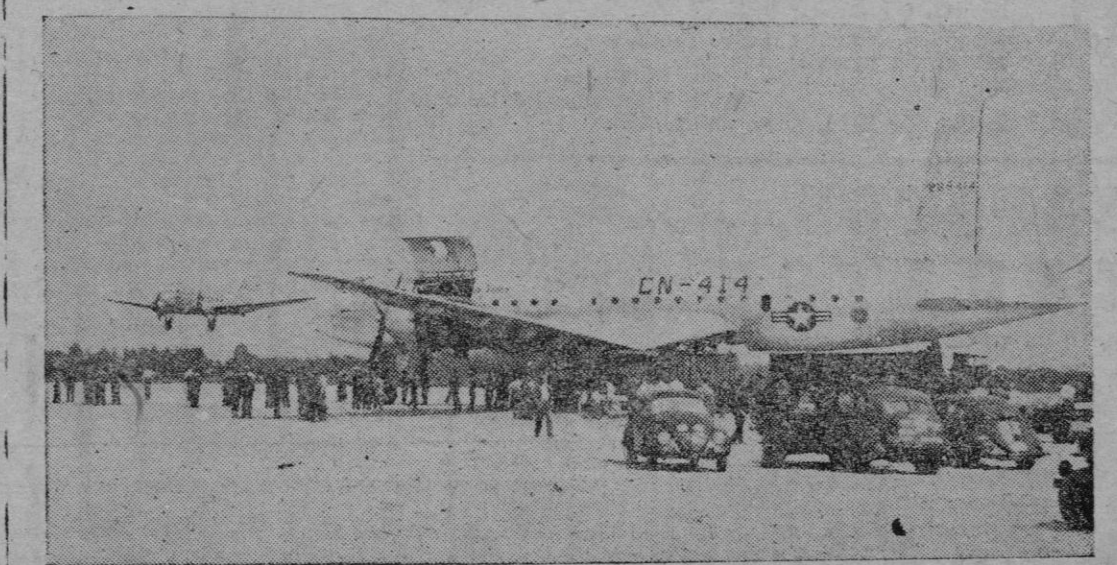
Prosigue con intensidad la ayuda que los occidentales prestan a la hambrienta población de Berlín. Poderosos Dakotas norteamericanos alternan su breve paso por Gatow, en el sector británico, con los llamados mamuts aéreos "Globemaster", los cuales provistos de montacargas propios, aligeran sus panzudas líneas de toda clase de pertrechos.

Automáticamente se procederá a la renovación de las Corporaciones Provinciales en la misma forma que determina la Ley de Administración Local y a la representación en Cortes de los Municipios y Provincias.