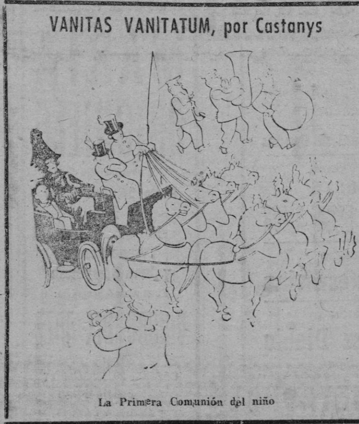
La Primera Comunión del niño

La unión de Europa es un complemento indispensable para el plan Marshall, todo lo que hacemos en Europa se hace con el beneplácito de los Estados Unidos.