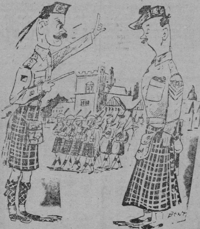
—Sargento Smith, la tradición es algo más importante que la moda. ¡Quítese estas faldas largas! (De "Mare Aurelio" - Roma)