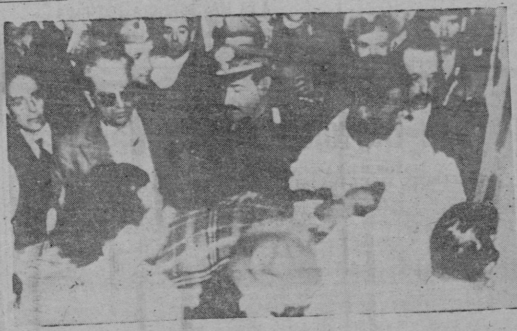
Casi inmediatamente después de perpetrado el atentado, el agresor cayó en manos de varios togliattistas, quienes, de no mediar la policía, le hubieran linchado. En la foto, vemos al joven estudiante que atentó contra la vida del jefe comunista italiano, conducido en una camilla al equipo sanitario de la Cámara de Diputados

ADEN, 28 (Efe). — Se confirma que una de las tres superfortalezas volantes norteamericanas que daban la vuelta al mundo se ha hundido en el mar, cerca de Aden, y poco tiempo después de despegar con dirección a Colombo. Los otros dos aviones han regresado a Aden. El sargento Gustaffen sobreviviendo del accidente, se encuentra en el hospital de Aden y dice que fue arrojado del avión cuando éste se hundió y que el volver a la superficie no vio a ninguno de sus compañeros de viaje. Inmediatamente después de producirse el accidente, barcos británicos salieron con dirección al lugar que se había producido el accidente y los buzos han comenzado su labor para rescatar los cadáveres y los restos del aparato. 19 DESAPARECIDOS WASHINGTON, 28 (Efe). — El mando aerostático de Estados Unidos anuncia que todavía no se han encontrado 19 de los 20 ocupantes de la superfortaleza volante que se estrelló contra el mar cerca de Aden.