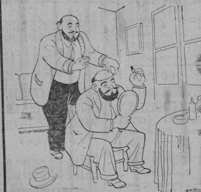
—Bueno ahora ya podemos efectuar el traspaso del piso sin que el propietario de la casa de entere.