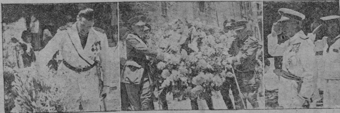
Los Excmos. Sres. Gobernador Civil, Capitán General y Vicealmirante Vierna al colocar las coronas ante el monumento a los Caídos.