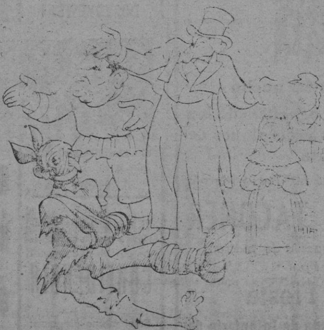
—A pesar de vuestro aspecto os hemos reconocido.