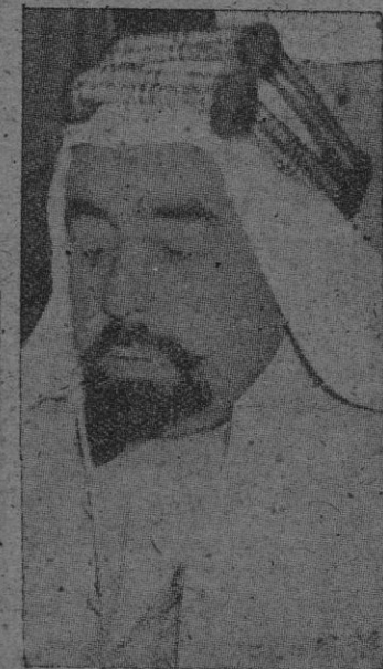
El rey Abdullah de Transjordania para por las fuerzas de Transjordania.

fuente competente se anuncia que, a las cinco de la mañana, la ciudad de Jericó estaba tranquila y que no había sido ocu-