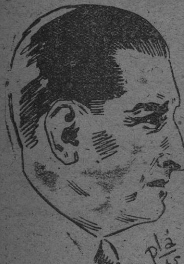
El Dr. Oliveira Salazar.

FELICITACIONES LISBOA, 27. (Efe). — El Jefe del Estado, Mariscal Carmona, se presentó esta mañana personalmente en la residencia del Jefe del Gobierno para felicitarlo con motivo de cumplirse sus veinte años al frente del Gobierno.