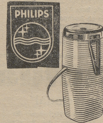
MOLINILLO DE CAFE

Europa, 2; Orcasitas, 0 (0-1). Unión, 4; Tajamar, 0 (2-4).