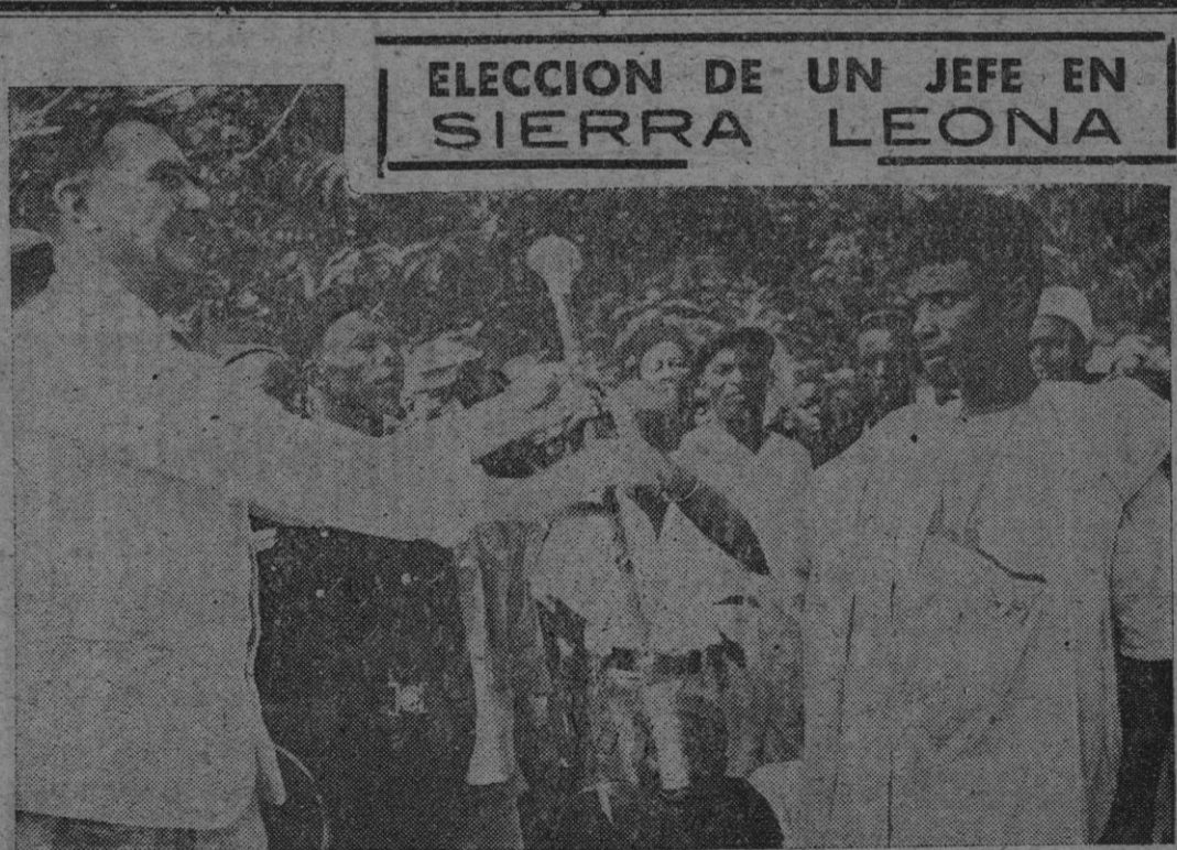
ELECCION DE UN JEFE EN SIERRA LEONA

SOUTHAMPTON 5.— EL EX-REY MIGUEL DE RUMANIA Y LA REINA MADRE, ELENA, HAN EMBARcado A BORDO DEL TRASATLANTICO «QUEEN ELIZABETH» RUMBO A LOS ESTADOS UNIDOS.