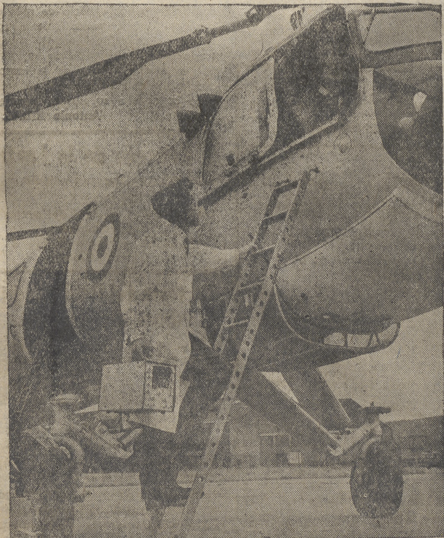
Un transistoscopio de baterías, colocándose a bordo de un helicóptero, para probar sus sistemas eléctricos. Pesa solamente seis kilogramos, es independiente del tendido eléctrico, y es ideal para comprobar circuitos de aeronaves sin llevarlas a los hangares.