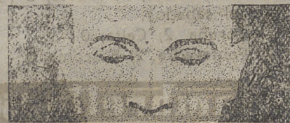
SENOS NASALES DESCONGESTIONADOS

Cuando usted se acatarra, la congestión invade la zona crítica de los senos nasales y frontales. La congestión dificulta su respiración y origina opresión y dolor. Usted tiene la cabeza pesada, siente cansancio y fiebre.