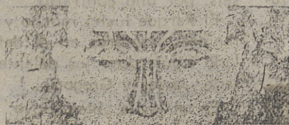
SENOS NASALES CONGESTIONADOS

En pocos minutos... su cabeza se despeja durante horas... Ud. se siente aliviado!