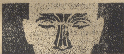
SENOS NASALES CONGESTIONADOS

¡ En pocos minutos... su cabeza se despeja y durante horas... Ud. se siente aliviado !