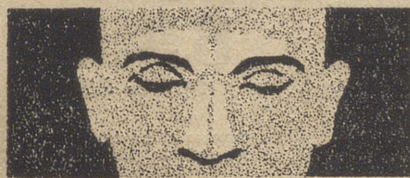
SENOS NASALES DESCONGESTIONADOS

Cuando usted se acatarra, la congestión invade la zona crítica de los senos nasales y frontales. La congestión dificulta su respiración y origina opresión y dolor. Usted tiene la cabeza pesada, siente cansancio y fiebre.