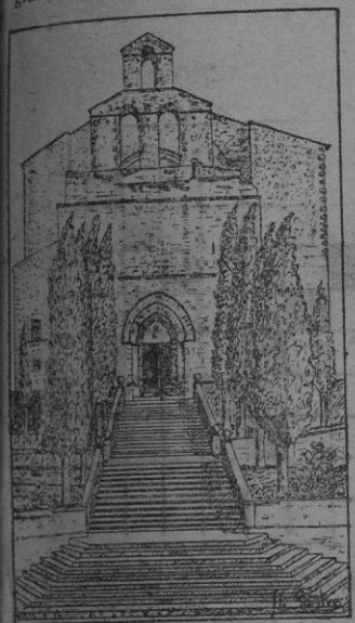
Estado actual de la fachada y de la escalinata.