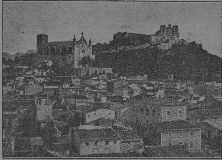
El pueblo de Artá, con el santuario de la Virgen de San Salvador al fondo

sica serenidad del aeda homérico y el popular y añejo sabor de los antiguos “glossadors”, a cuyo final pronuncio atinadas frases de estímulo en su preciado or, el ilustrado Economo