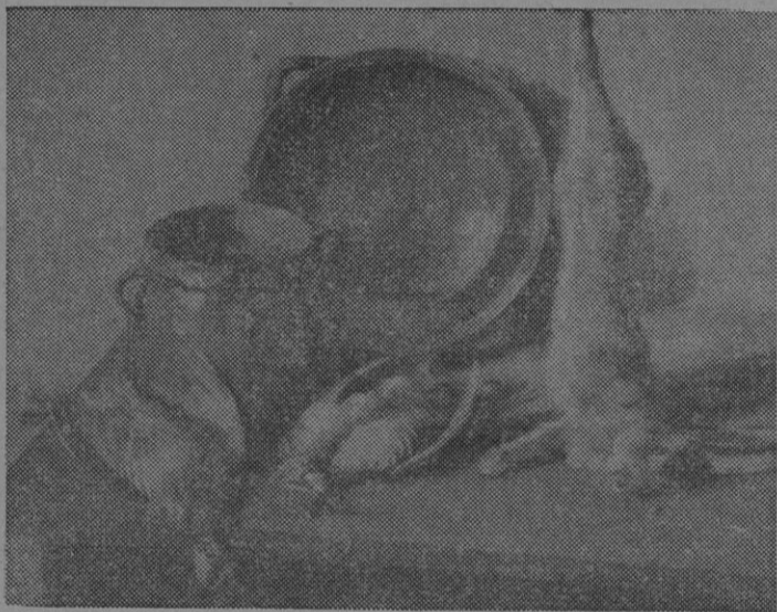
Un bodegón de Guillermo Vadell, expuesto en el Círculo de Bellas Artes.

matizada, de verdes de montaña, se escalona desde las cumbres hasta la ribera, resolviendo todos los detalles, todos los aspectos del difícil tema rodeado de una atmósfera real y sugestiva.