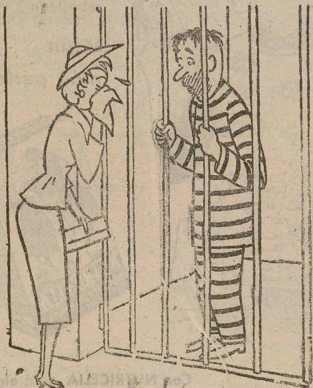
—He perdido las llaves, ¡Estoy en la calle!