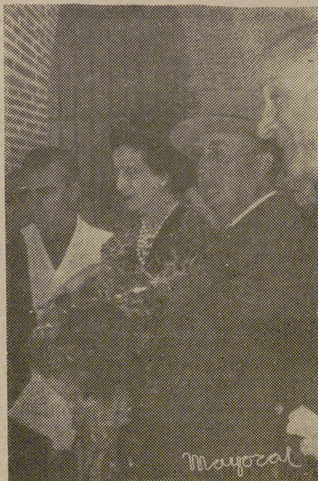
Franco visitó la tierra de Avila y los abulenses recordamos su presencia en compañía de su nobilísima esposa en el Castillo de Arévalo.

«Durante ese tiempo —afirmó— hemos querido que la presencia de la Diputación en los pueblos fuese