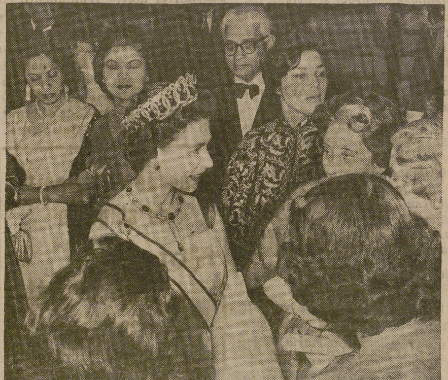
Bienvenida en Karachi a la Reina de Inglaterra Isabel II. Tanto a ella como al Príncipe Felipe, agasajaron las gentes haciendo caer sobre ambos una lluvia de pétalos de flores.