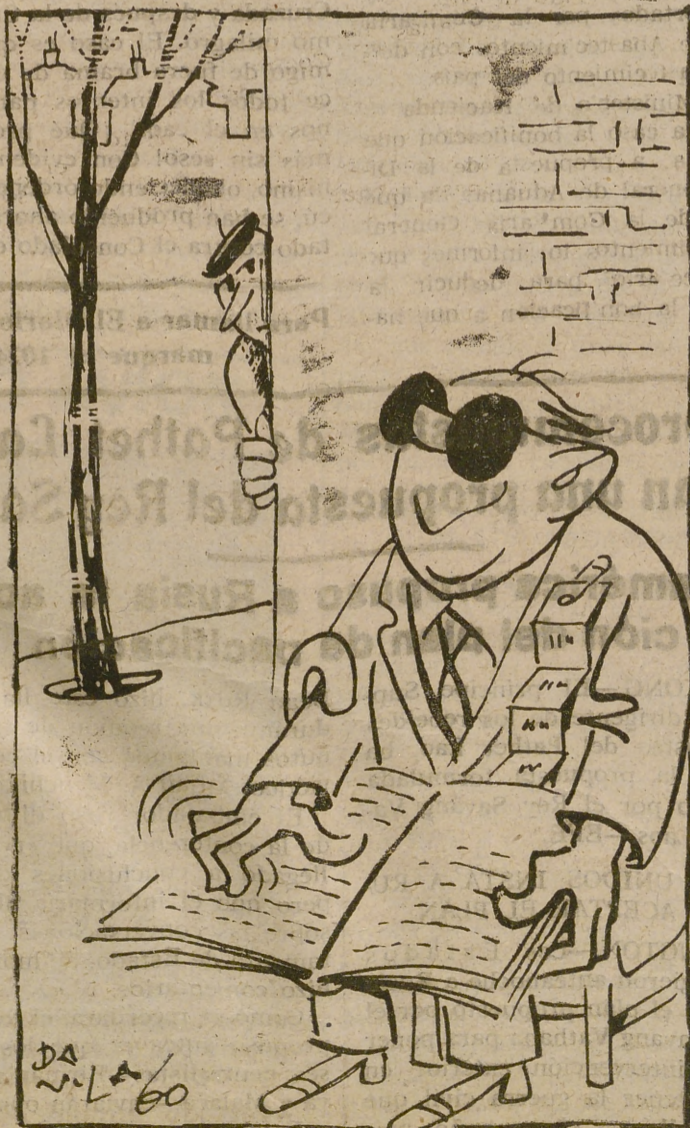
Analfabeto: Hay quien ve más que tú

Síntesis.—El conde Lavut, vampiro muerto en la película anterior, "El vampiro", de la que ésta es segunda parte, resucita porque le quitan la estaca que llevaba clavada en el pecho y se dedica a sus habituales labores de chupador de sangre, tomando como objetivo a los dos protagonistas que, por serlo, acabarán indemnes, logrando ensartar de nuevo al malvado conde. Al inventar nuevas hazañas, apartándose del vampirismo cinematográfico, la cinta adquiere un exagerado tono reiterativo y macabro hasta los límites del buen gusto. Realización mediocre, truculentos y abuso de fortísimos musicales para recargar los momentos críticos. Interpretación vulgar. Sería moralmente reprobable del todo si estas cosas pudiesen tomarse en serio por alguien.