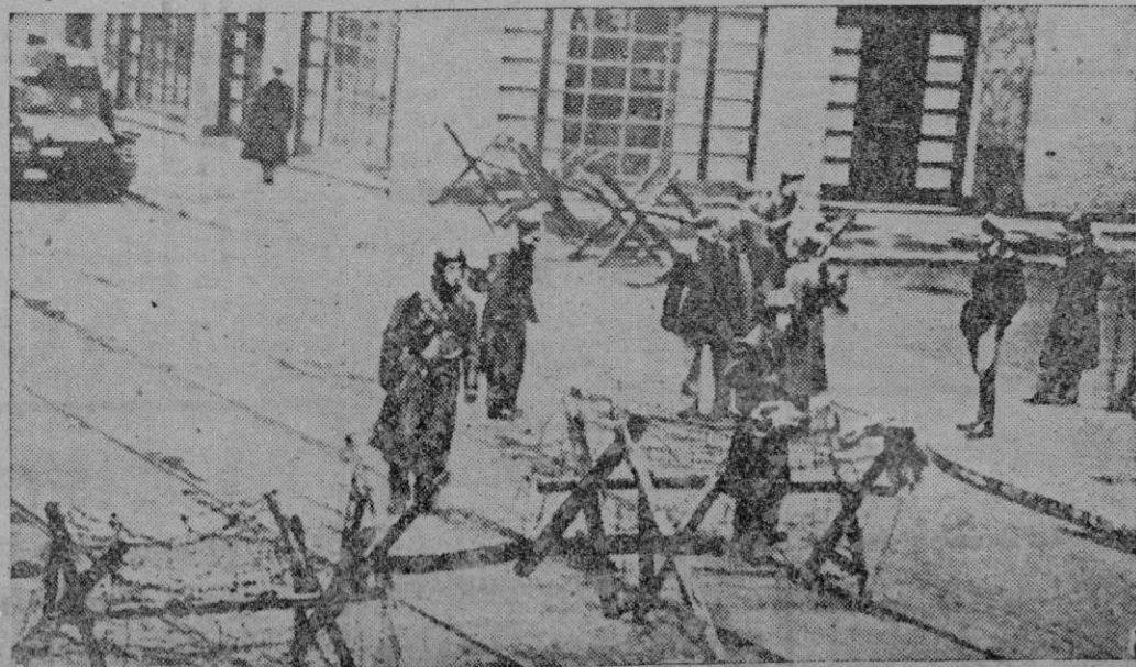
Tropas italianas prestando servicio a vigilancia tras las alambradas que interceptan esta calle de Milán durante las 24 horas de dominio comunista que la ciudad sufrió últimamente.