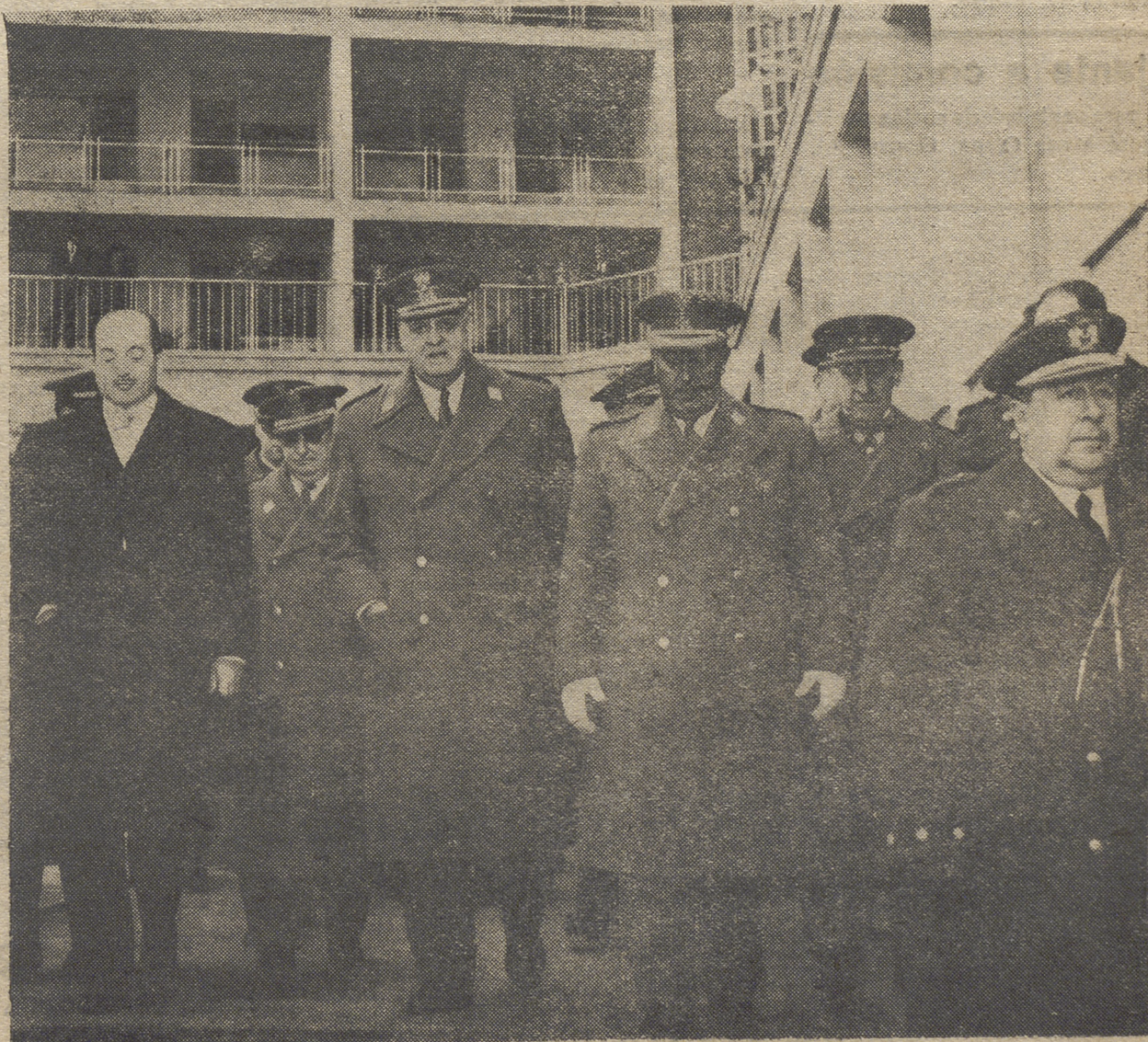
El Caudillo, que días pasados en compañía de varios ministros inauguró la Residencia «Generalísimo Franco», nuevo centro formativo destinado a los hijos de generales, jefes y oficiales del Ejército—acto al que corresponde el grabado—acudió ayer a la inauguración del nuevo edificio e instalaciones de la Editorial Católica, acontecimiento del que ofrecemos amplia información a nuestros lectores.