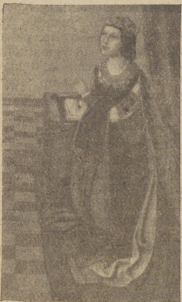
Isabel «la Católica»

Este título le queremos los abulenses para la Reina Católica, nacida en Madrigal de las Altas Torres