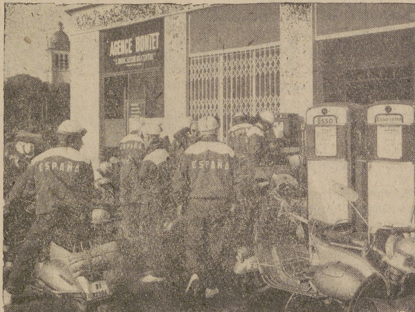
Los vespistas españoles repostando en un surtidor francés. Bilbao, Zaragoza, Zamora, hermandad entre los vespistas.

Y la Vespa cumple sumisamente con el anacronismo, como cumplió antes por carretera abierta, salvando kilómetros y kilómetros, nave-