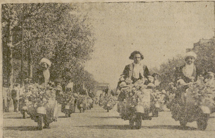
El equipo italiano con maravillosos trajes regionales fué muy bien acogido en Francia. Desfila por los Campos Eliseos.

Desde un rincón de la inmensa plaza de la Concordia se puso en marcha, conducida por centenares de Vespas, una insospechada mezcla de culturas y lenguas, de trajes, de estamentos, épocas y estilos. La historia, arbitrariamente barajada en un heterogéneo juego de naipes con ilustraciones a todo color. Hombres y mujeres de Alemania, Inglaterra, Bélgica, Sarre, Holanda,