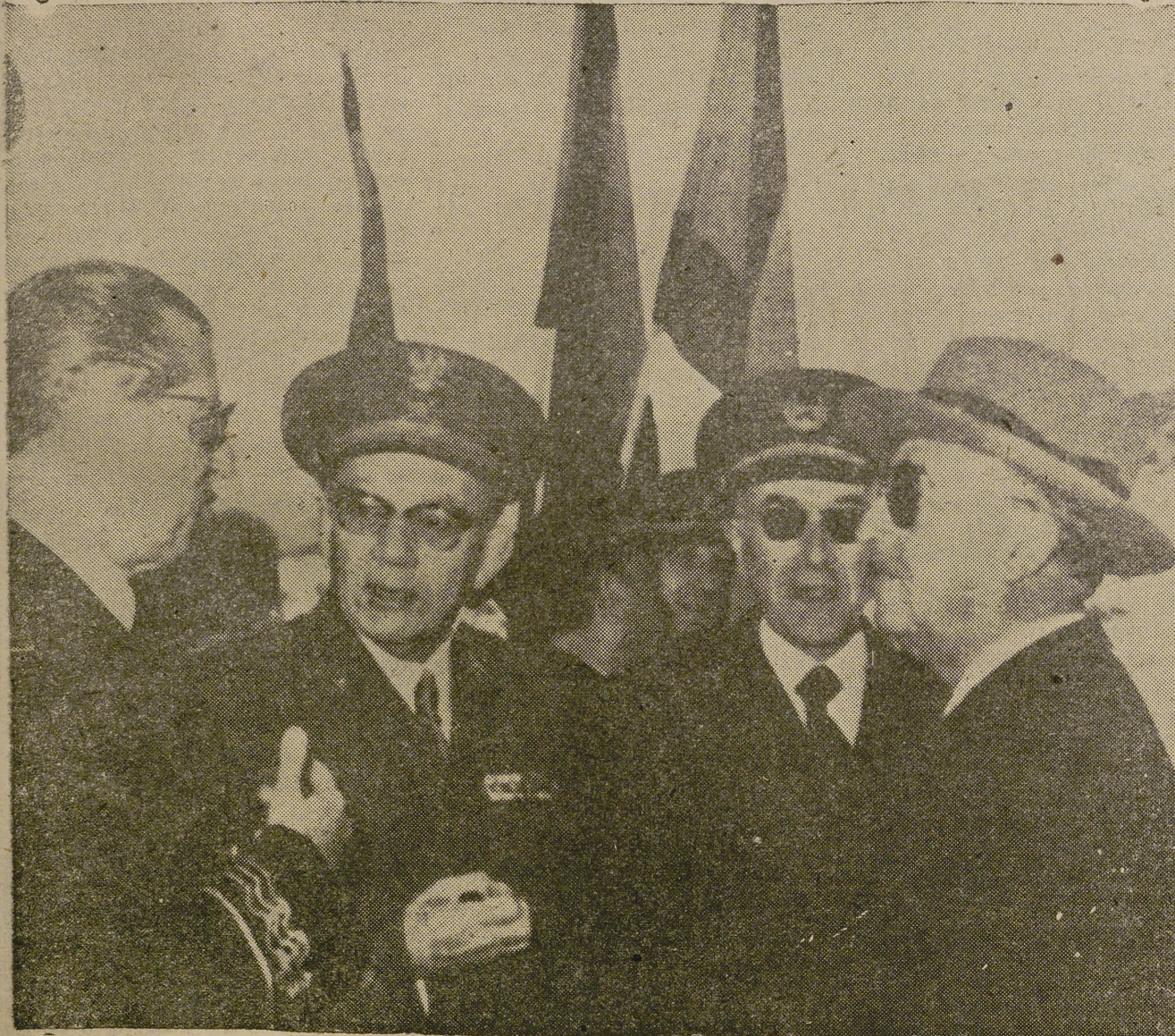
No habiéndonos llegado a su tiempo nos complacemos en publicar hoy la foto que precede referente a un acontecimiento de gran relieve nacional.

SANGÜESA.—S. E. el jefe del Estado, acompañado de los ministros de Obras Públicas, Agricultura y Gobernación, y de otras personalidades, contemplando el pantano de Yeso, que embalsa 460 millones de metros cúbicos y donde tomará sus aguas el canal de Las Bardenas para regar 20.000 hectáreas de tierra.—(Foto Cifra Gráfica).