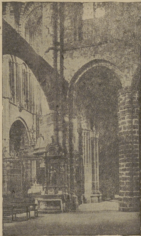
Interior de la Catedral

En las diferentes fases del estilo ojival, tenemos diversas muestras, descontada ya la Catedral, citaremos la de Mosén Rubí de Bracamonte de planta octogonal, los restos de la de San Francisco; San Juan, que conserva la pila en que bautizaron a Santa Teresa; Santa Ana, centro educador de Isabel la Católica; Nuestra Señora la Antigua, fundada según antiquísima tradición sobre otra existente en tiempo visigótico, junto al lugar de la recientemente aparecida necrópolis y sobre todas el Real Monasterio de Santo Tomás de Aquino, dominico, residencia veraniega de Fernando e Isabel, Sede durante seis años de la Santa Inquisición, Vieja Universidad; bajo cuyas labradas bóvedas duerme el sueño eterno, aquel joven, "Esperanza de España", único hijo varón de ambos, que por morir a tan temprana edad cambió los destinos de la Patria: El Príncipe Don Juan.