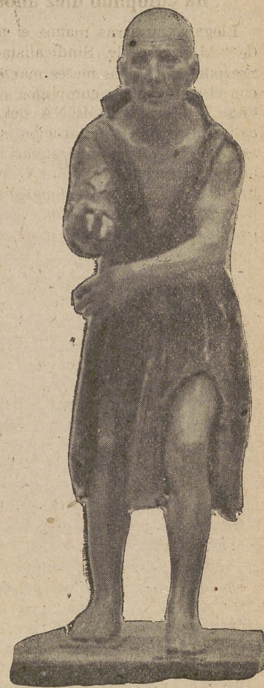
El Pobre Lázaro, maravillosa escultura del tesoro artístico abulense

Por el día el aire, puro al sol radiante, deja ver hasta el mínimo detalle.