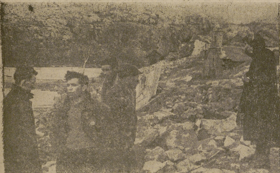
Del lugar donde marca la flecha bajaron las aguas que arrasaron al pueblo de Ribadelago; un pequeño pueblo zamorano situado en un valle al pie de unas agudas montañas. Quedó en pie la torre de la iglesia. Esa viejecita perdió sus hijos y nietos, y él perdió la mujer con quien ocho días antes habíase casado.

Avila conmemoró brillantemente el XXIII aniversario del discurso de José Antonio en el Teatro Liceo