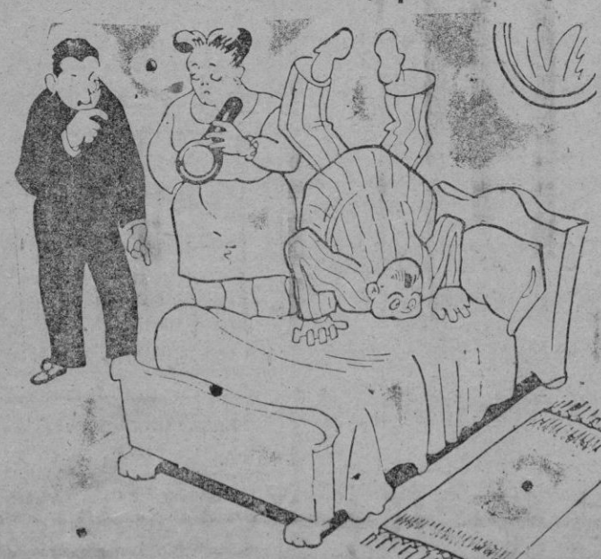
—ES UN ENFERMO TAN VARIABLE, TAN VARIABLE, QUE EN VEZ DEL TERMOMETRO LE PONEMOS EL BAROMETRO.