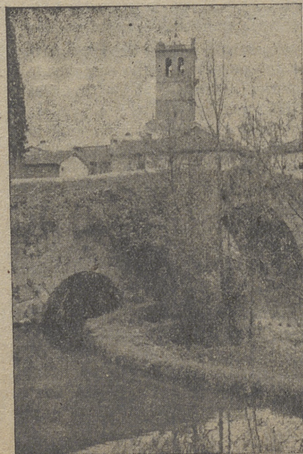
ARENAS DE SAN PEDRO (iglesia y puente romano)

Otro verdadero Monumento que posee Arenas de San Pedro es su Iglesia Parroquial, soberbio templo de puro estilo gótico que se elevó en la segunda mitad del siglo XIV y al que se le adosó, posteriormente, una esbelta torre cuadrada de estilo Renacimiento. Alberga en su interior