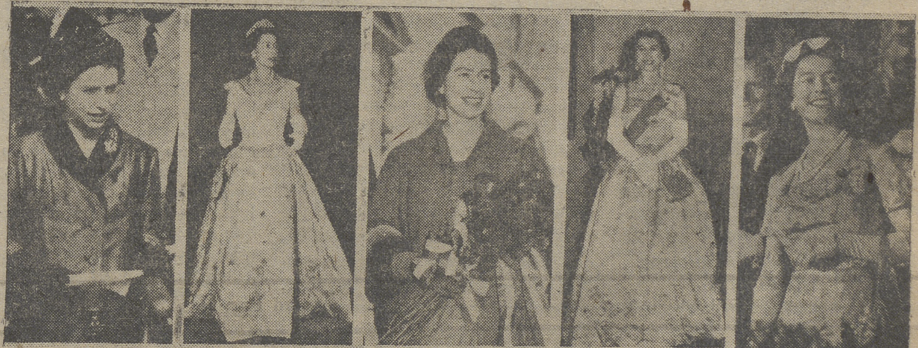
Diversas fotos de la Reina Isabel II en su visita a los Estados Unidos del Canadá. La Reina ha dicho, recordando su reciente visita: que recibió la más amistosa y entusiasta bienvenida que recuerda: «Mi visita me ha convencido más aún de que los lazos que unen a nuestros pueblos son más fuertes y duraderos». Hizo estas declaraciones en la ceremonia de clausura de la Legislatura en la Cámara de los Lorees. La ceremonia se celebró como es tradicional permitiendo a los miembros de la Cámara de los Comunes asistir a la sesión de la Cámara de los Lorees. Esta ceremonia recibe el nombre tradicional de «Black rod» (vara negra). También se refirió a la cuestión de Omán: «En vista de los lazos que unen a este Sultanato con mi Gobierno acepto rápidamente la acción de mis fuerzas en respuesta a la petición del Sultán».