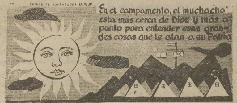
En el campamento, el muchacho está más cerca de Dios y más o punto para entender esas grandes cosas que le otan a su Patria

Continúan abiertos al público hasta el 30 de septiembre.