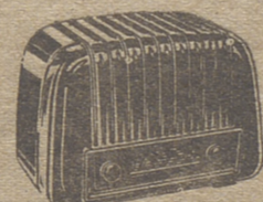
SONATA PTAS. 1.995,00