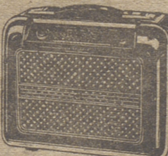
CICERONE PTAS. 3.485,00