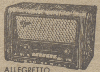
ALLEGRETTO PTAS. 3.575,00

TELEFUNKEN ha proporcionado servicios útiles y satisfacciones durante 30 años en todos los países del mundo. Confíe a TELEFUNKEN la alegría de su hogar.