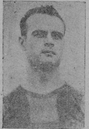
EL INTERNACIONAL CURTA

VIERNES: Barcelona-Mallorca. SABADO: At. Madrid-Mallorca DOMINGO: Barcelona-At. Madrid Anoche se recibieron, aproximadamente a la misma hora, noticias de los dos grandes clubs de Prime-