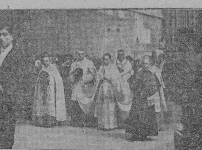
Dos aspectos de la solemne procesion que anteayer recorrió nuestras calles.